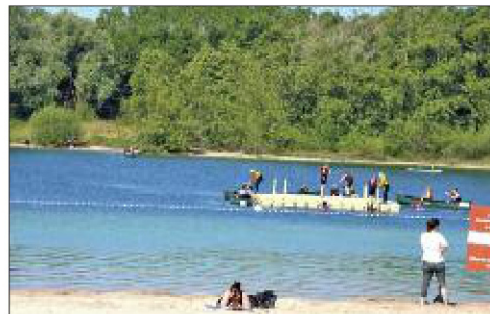
Le plan d'eau et de loisirs du Staedly à Roeschwoog avec son tout nouveau restaurant italien ouvert à tous.

On ne peut passer sous silence la richesse culturelle de la région avec le musée Passo à Drusenheim, la péniche musée Capro à Offendorf, le musée Goethe à Sessenheim et la passe à poissons à Gamsheim. L'histoire s'écrit aussi en grand avec le Fort Vauban à Fort-Louis, les multiples calvaires à Gamsheim ou le Heidenbuckel (un édifice de la ligne Maginot) à Leutenheim. Curiosité également avec le bac gratuit Drusus à Drusenheim, remis en service après un arrêt technique d'entretien.