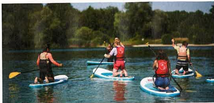
Pays Rhénan

Rens. et insc. +33 (0)3 88 96 44 08 - accueil@ot-paysrhenan.fr - visitspaysrhenan.alsace